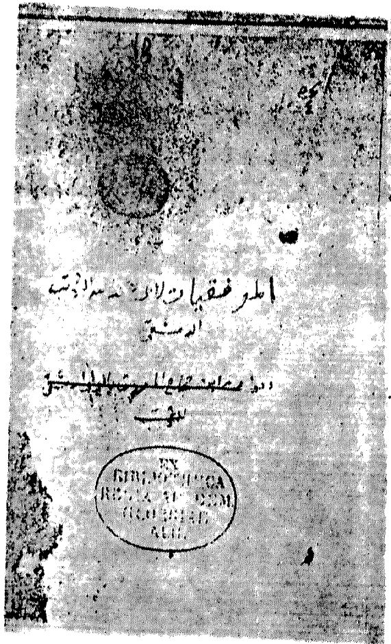
الصفحة الأولى من نسخة جوتنجن